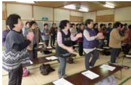
高齢者の生きがいがづくり