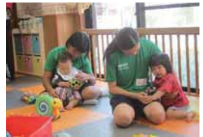
地域福祉のために