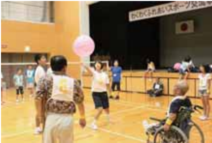
障がい者福祉のために

このうち今年度、平戸市の地域福祉活動へ 5,840,000円 が助成され、下記の活動の資金として大切に活用されます。