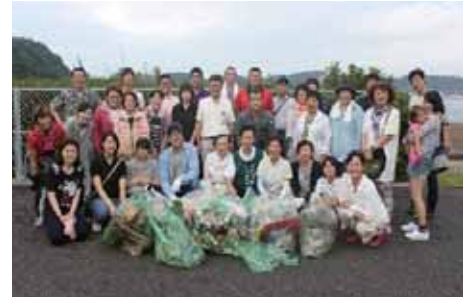
ボランティア活動のために