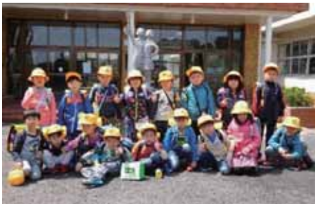
児童福祉のために