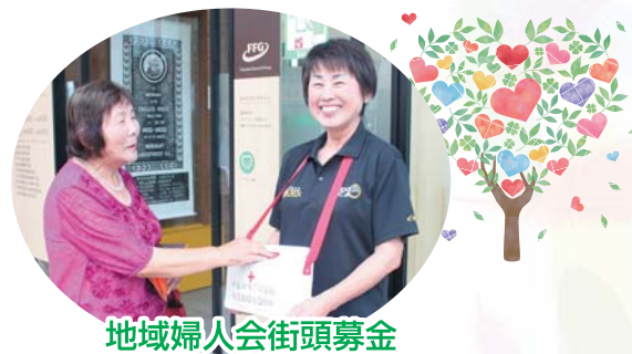
地域婦人会街頭募金