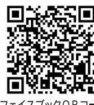
フェイスブックQRコード

【公式Facebook】https://www.facebook.com/hiradoshakyo