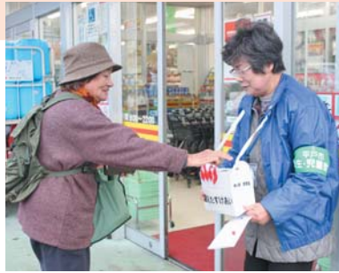
北部支部民生児童委員協議会