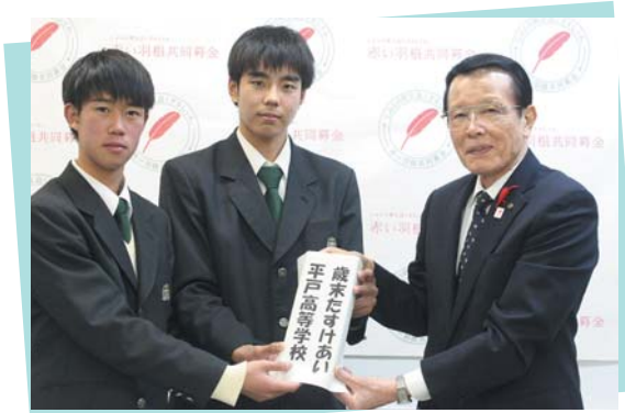
平戸高校 様よりご寄付