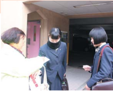
地域婦人団体連絡協議会