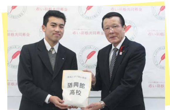
猶興館高校 様よりご寄付