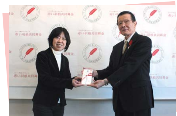
長崎県看護協会 県北支部 様よりご寄付