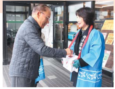
平戸市母子寡婦福祉会