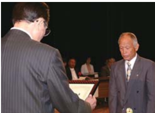
▲平戸市社会福祉協議会表彰

この社会福祉大会の開催にあたり、平戸市をはじめ多くの皆様にご協力をいただきました。改めましてお礼を申し上げます。今後も平戸市社会福祉協議会は、住民の皆様の福祉向上に尽力して参ります。今後ともよろしくお願ひ申し上げます。