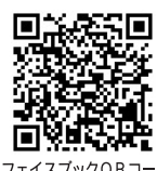
フェイスブックQRコード

【公式Facebook】https://www.facebook.com/hiradoshakyo