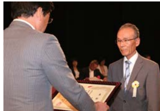
▲長崎県共同募金会平戸市支会表彰