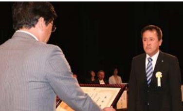
▲日本赤十字社長崎県支部平戸市地区表彰