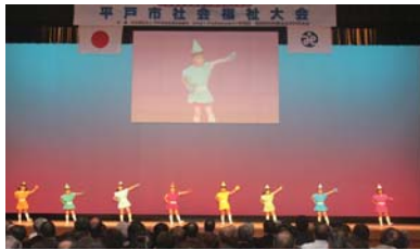
▲野子町へき地保育所園児によるアトラクション演技