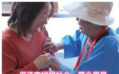
母子寡婦福祉会 募金風景