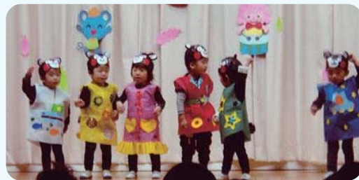
▲志々伎町へき地保育所

11月13日～12月13日にかけて、5ヶ所の各保育所でおゆうぎ会が行われました。園児は一生懸命練習したおゆうぎを、保護者の前で元気いっぱい披露し、かわいらしい演技に、皆さん自然と笑みがこぼれていました。おゆうぎ会をとおして、ひと回り成長した園児の姿がありました。