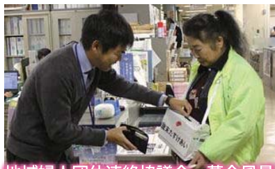
地域婦人団体連絡協議会 募金風景