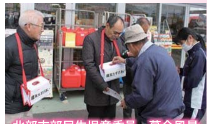
北部支部民生児童委員 募金風景