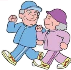
高齢者の生きがいづくり