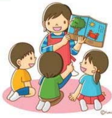
ボランティア活動の推進